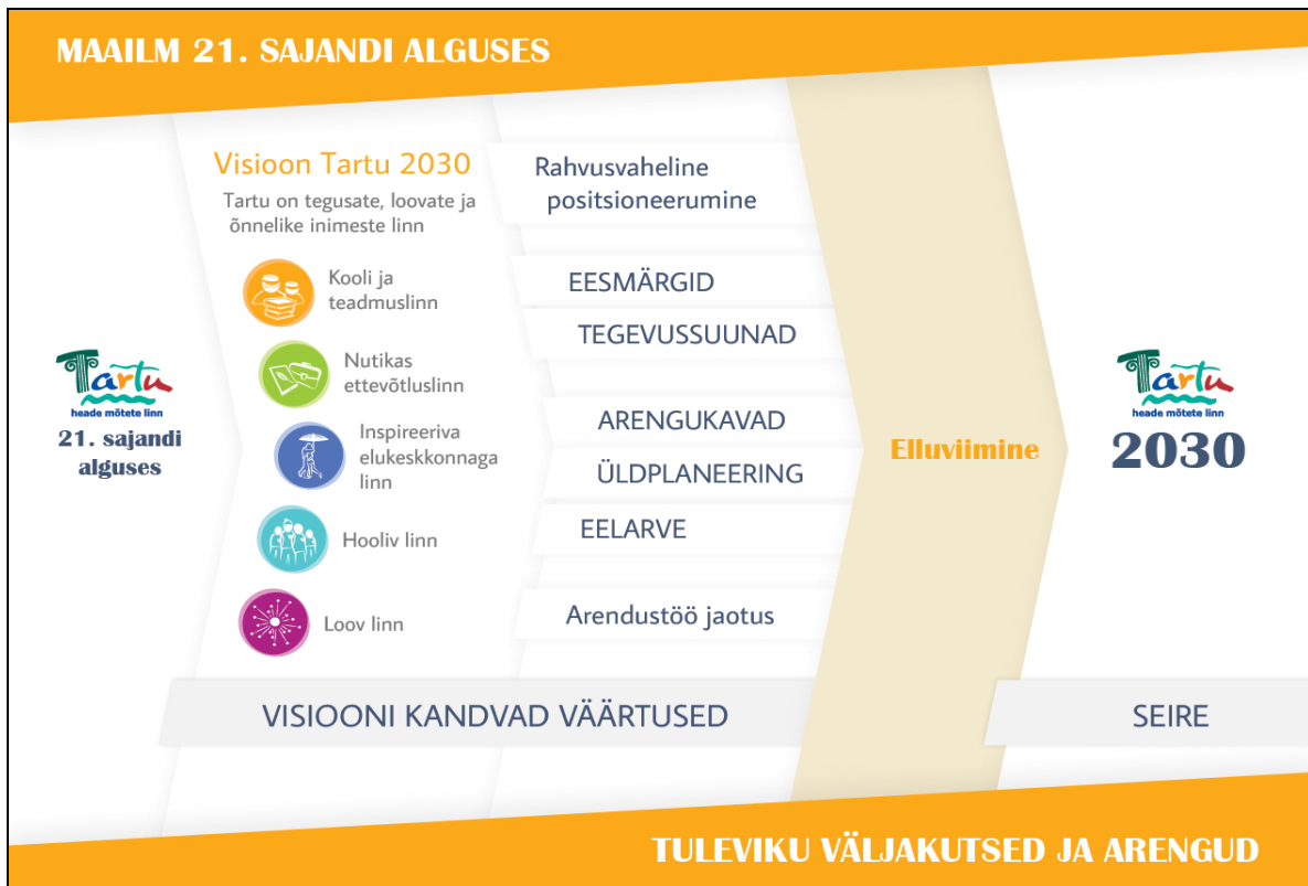
Joonis 1. Tartu strateegilise arendamise mudel